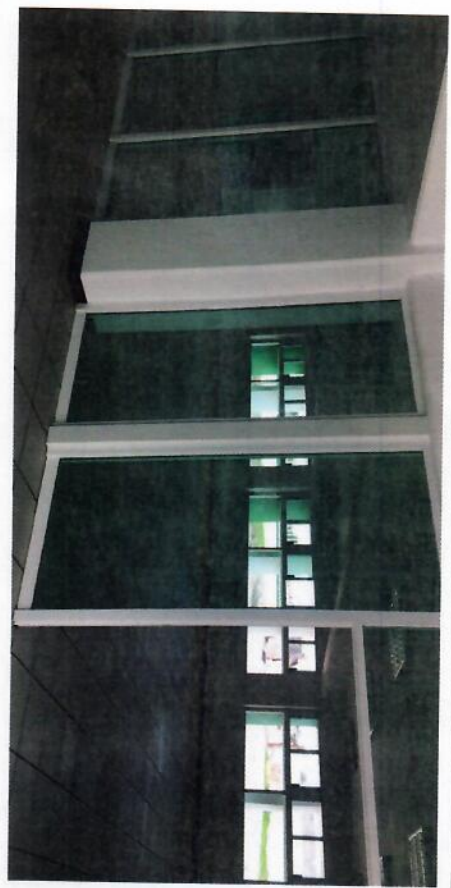
DESCRIPCIÓN DE LA OBRA

TECNOLÓGICO NACIONAL DE MÉXICO SECRETARÍA DE DE PLANEACIÓN EVALUACIÓN Y DESARROLLO DEL SISTEMA INSTITUCIONAL DIRECCIÓN DE PROGRAMACIÓN, PRESUPUESTACIÓN E INFRAESTRUCTURA FÍSICA ÁREA DE INFRAESTRUCTURA FÍSICA Y MANTENIMIENTO